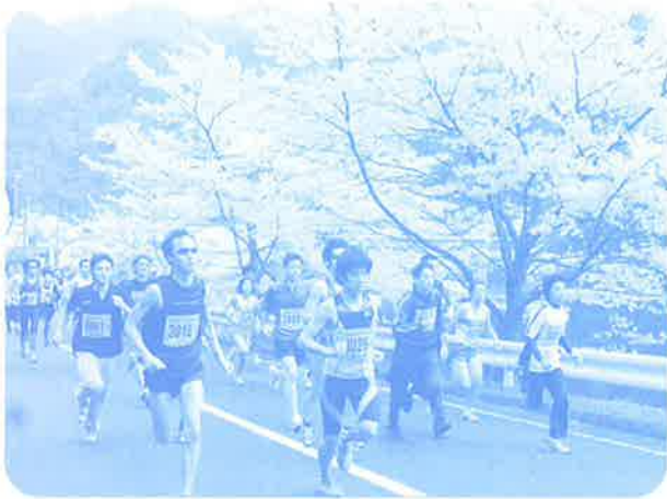
マラソンスタート